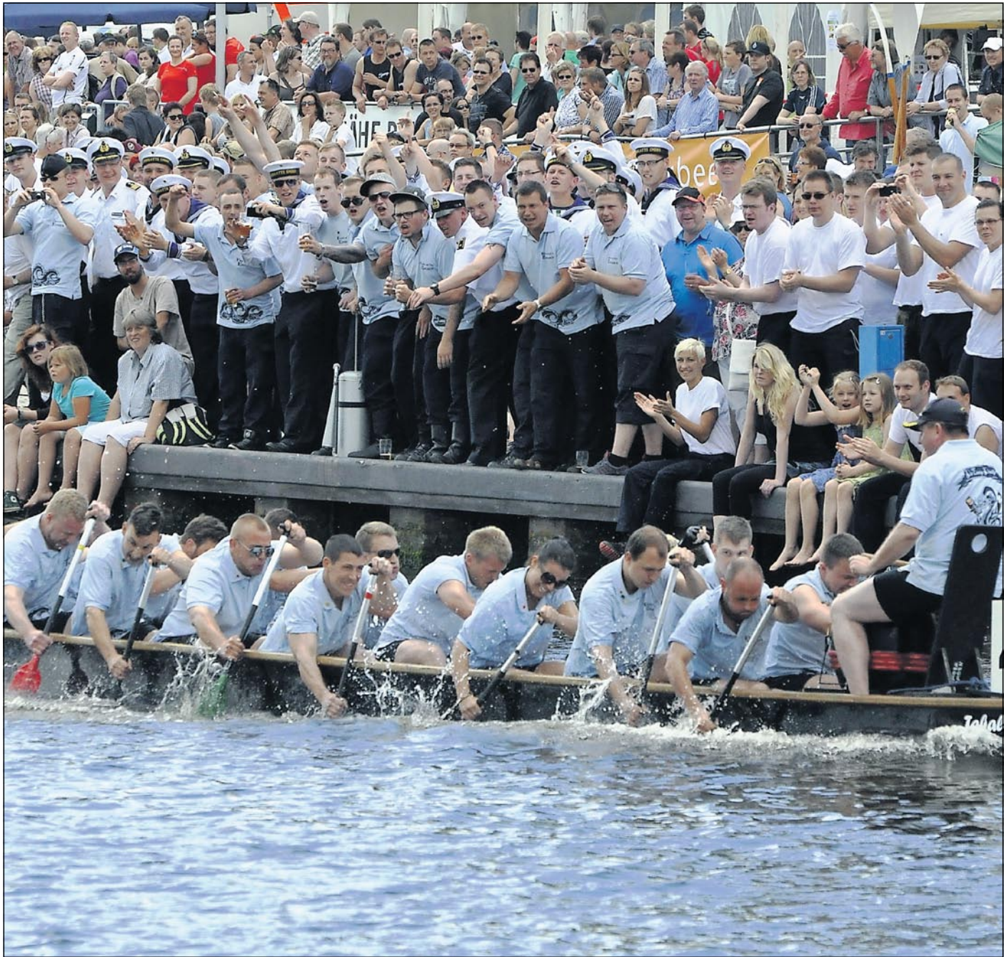
Der Besuch der Fregatte „Emden“ in der Patenstadt zur „Emder Hafenmeile“ und die Teilnahme

Häuser wurden innerhalb weniger Minuten überflutet: Bei einer Überschwemmung in der Schwarzmeer-Region kamen über 170 Menschen ums Leben. S. 21